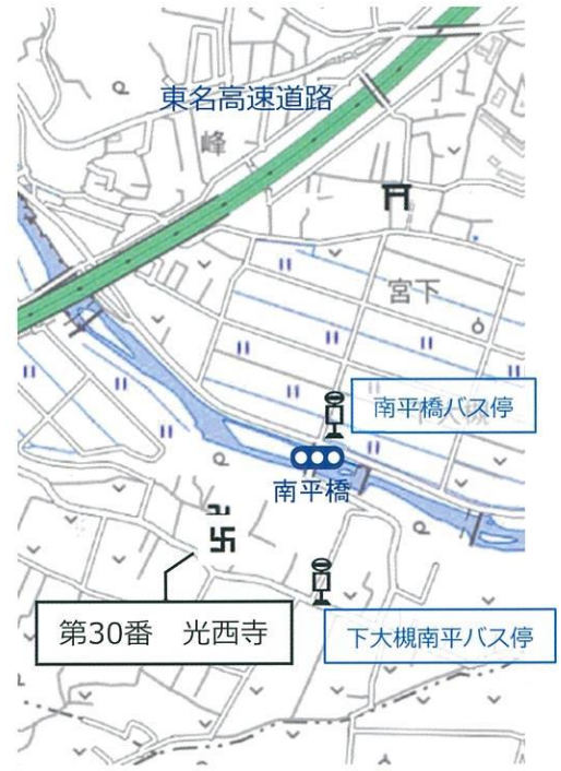
「地理院地図Vector」に寺院名等を追記して掲載